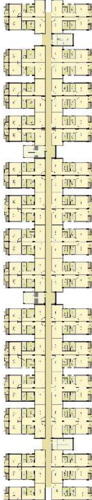
LIG-TOWER F TYPICAL FLOOR PLAN